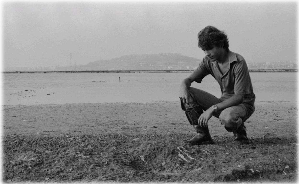
Giugno 1980 – Rilievi nell'area di nidificazione presso argine vasca salante Molentargius.