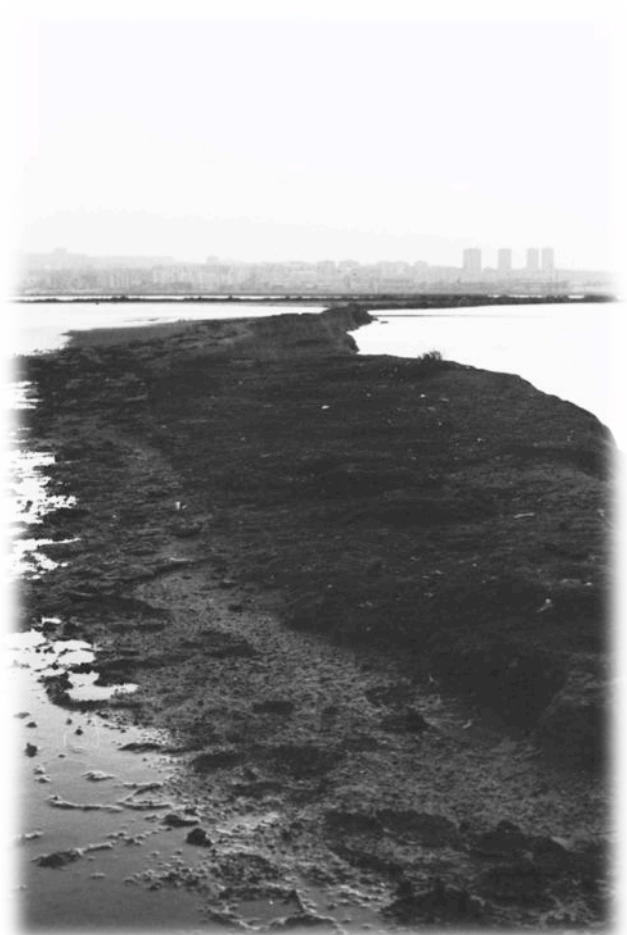
Giugno 1980 – Area di nidificazione fenicottero presso argine vasca salante Molentargius.